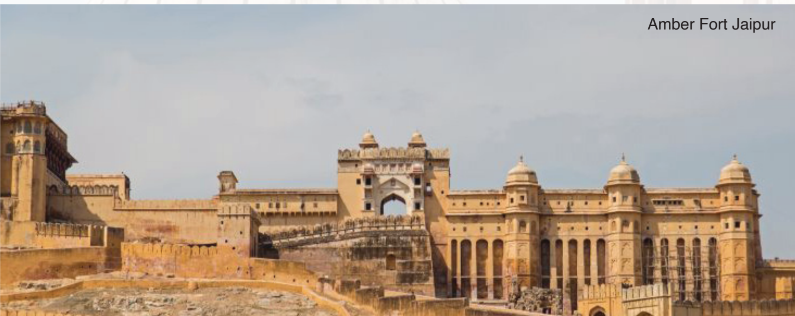
Amber Fort Jaipur