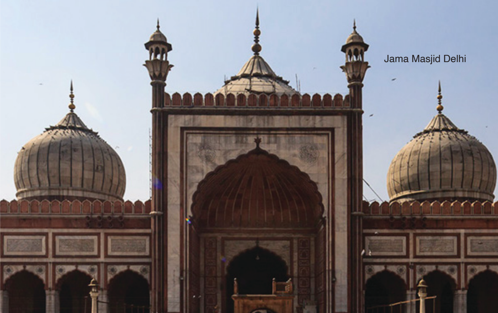
Jama Masjid Delhi

Indien ist ein faszinierendes Land, farbenfroh, verrückt, verwirrend und auch immer wieder fordernd aber niemals langweilig.